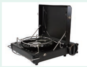
卓上をスマートにみせるブラックとシルバーの2色展開