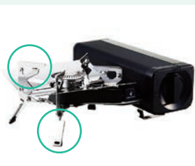
支持脚を3本出し、ごとく4つを折り曲げる