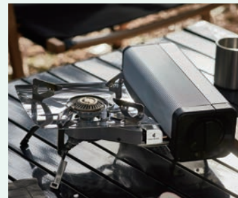
ブラックとシルバーの2色展開