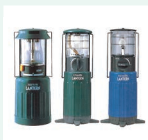
「カセットフォー ランタン」