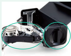
ユニットを引き出せば、点火つまみがあらわれます