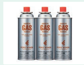
統一感を演出するブランドパッケージ