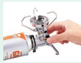
手のひらにおさまる、抜群の携帯性