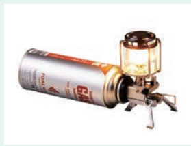
情緒的な明かりを灯すガスランタン