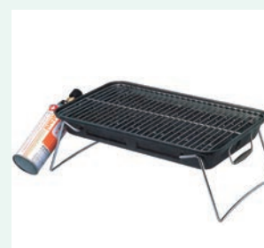
「カセットガスBBQグリル」