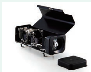
ラバーキャップを外し、容器カバーをあける