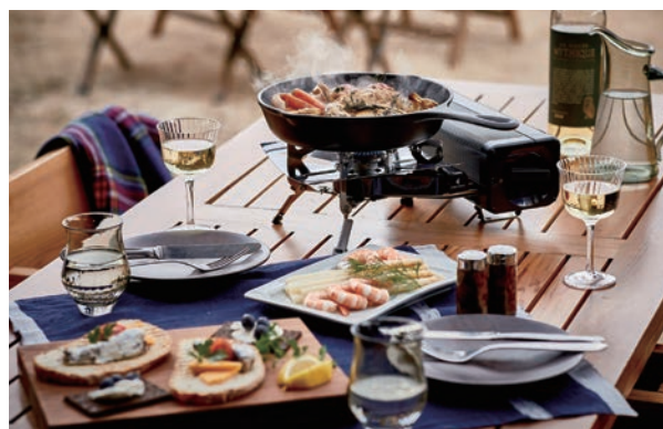
FOLDING CAMP STOVE

また、新メッセージ「SAVOR YOUR ADVENTURE」を直訳すると「冒険・探検を堪能する」。ガス&エネルギーのイワタニの技術を生かし、アウトドアでの楽しさやワクワクする感覚を、もっと身近に、多くの方に感じていただきたいとの想いを込めています。