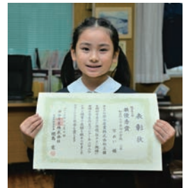
最優秀賞 低学年の部

「住みよい地球がイワタニの願いです」の企業スローガンにちなみ、当社は2010年から全国の小学生を対象に「住みよい地球」をテーマにした作文コンクールを実施。今回で11回目となります。同コンクールは、文部科学省・環境省などの後援を得て、小学校低学年の部と高学年の部の2部門で作品を募集。今回は、新型コロナウイルスの影響があったものの、海外を含む491校から3,783作品の応募がありました。(低学年の部788作品、高学年の部2,995作品)