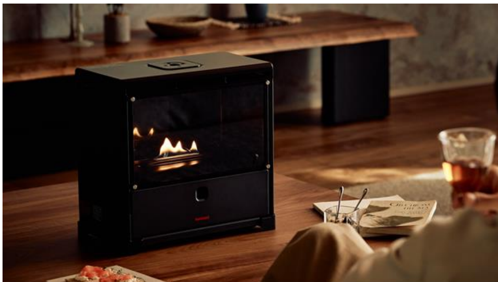
炎を楽しむインテリア暖炉 “MYDANRO”

岩谷産業株式会社（本社：大阪・東京、社長：間島寛、資本金：350億円）は12月18日より、カセットガス式で手軽に暖炉の雰囲気を楽しめる新商品「炎を楽しむインテリア暖炉 “MYDANRO”」（メーカー希望小売価格：税込 39,800円）の先行販売を、アタラシイものや体験の応援購入サービス「Makuake（マクアケ）」にて開始しました。