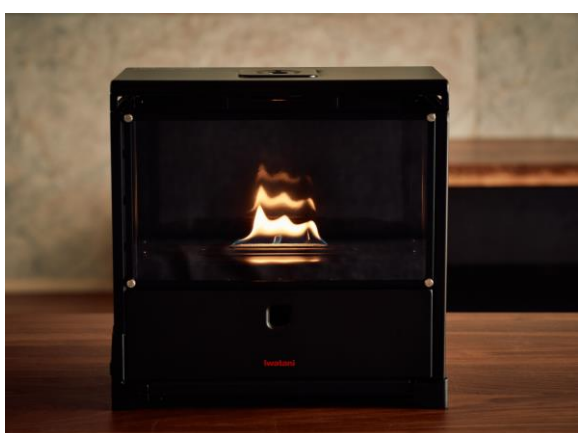
▲ 背面パネルに映る美しい炎の重なり

特許出願中の燃焼構造により、焚火の炎のゆらぎをイメージした、柔らかく美しい炎を実現。オールブラックの本体に、美しい炎が重なり映し出されます。暖房機ではありませんが、手をかざすと、じんわりと心地よい暖かさが伝わります。