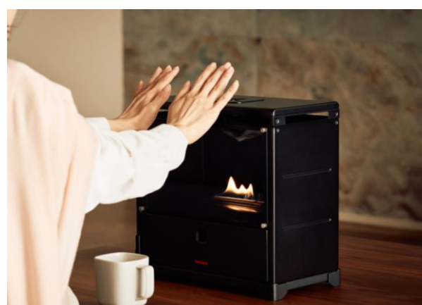
▲ じんわりと伝わる炎のぬくもり