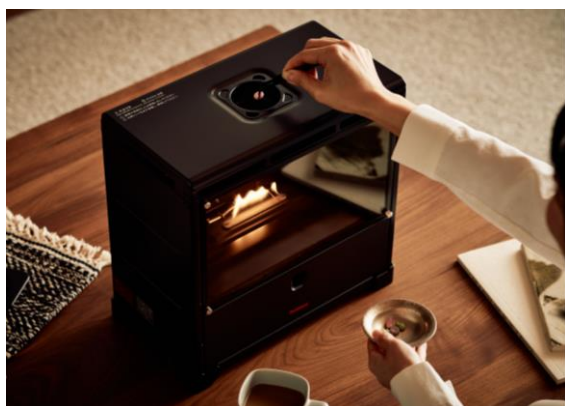
▲ お香を焚いて、香りでもリラックス

炎は耐熱ガラスやパネルに囲まれ、直接触れることのない安全設計です。バーナー部のフレイムロッドが燃焼状態を感知し、不完全燃焼を防止します。また、本体転倒時やカセットガスの内圧が異常に上昇した場合も、自動でガスを遮断し消火する安全機能も搭載しています。