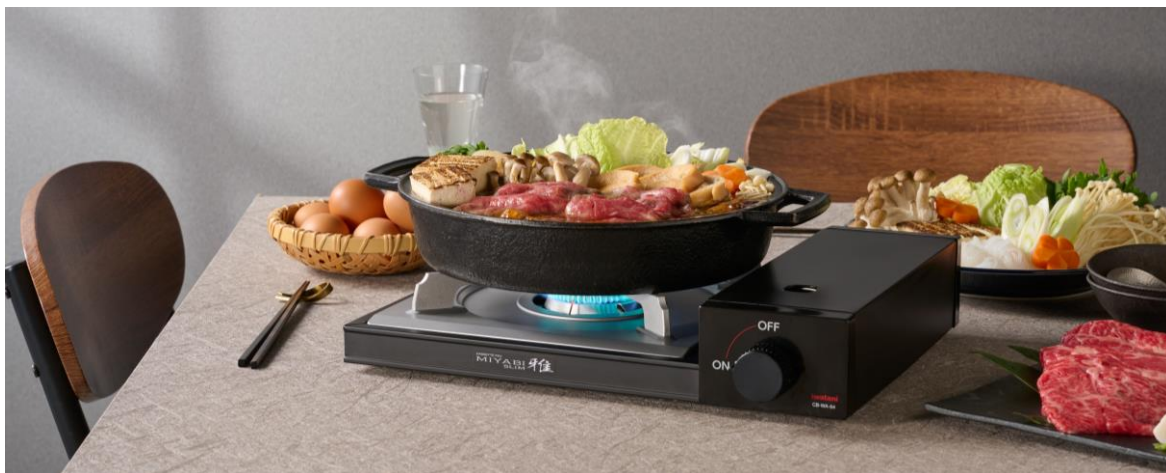
「カセットフー “雅 SLIM”」商品ページ

https://www.iwatani.co.jp/jpn/consumer/products/cg/stove/cb-wa-64/