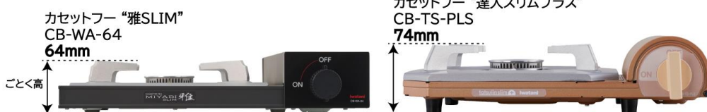
▲現行の薄型こんろ「カセットフー “達人スリムプラス”」（画像右）との比較