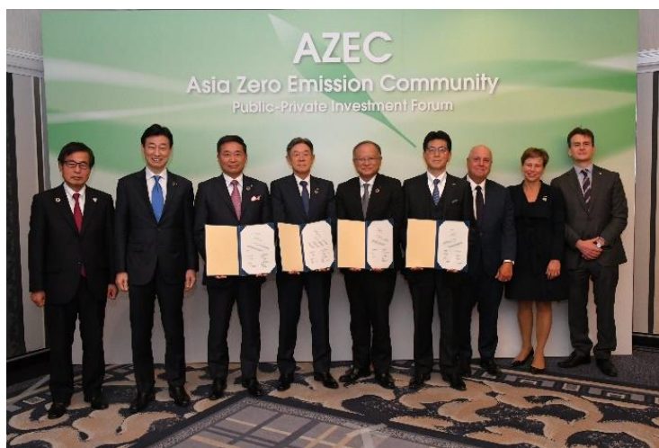
写真 AZEC官民投資フォーラム

なお、3月3日のアジア・ゼロエミッション共同体(AZEC)官民投資フォーラムにて、西村康稔経済産業大臣、石塚博昭NEDO理事長、豪州マクアリスター気候変動・エネルギー補佐大臣、豪州ヘイハースト駐日大使、豪州ビクトリア州政府パラス財務大臣の立ち会いの下、本グリーンイノベーション基金事業における商用化実証を進展させ、日豪間での国際的な液化水素サプライチェーン構築を進展させることに合意することの協力覚書が締結されています。