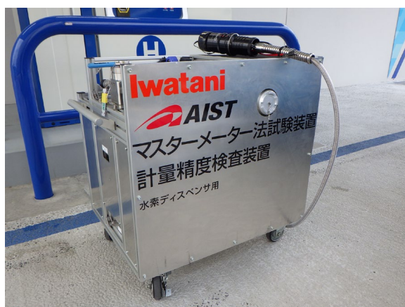
マスターメーター法検査装置