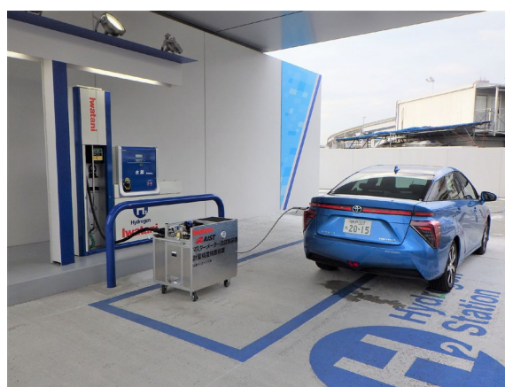
計量検査時の様子