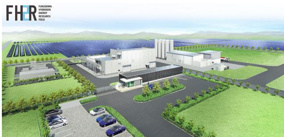
図1 福島水素エネルギー研究フィールド完成イメージ

2019年10月までに本システムの建設を完了させ、試運転を開始し、2020年7月までに技術課題の確認・検証を行う実証運用と水素の輸送を開始する予定です。なお、本システムで製造された水素は、燃料電池による発電用途、燃料電池車・燃料電池バスなどのモビリティ用途、工場における燃料などに使用される予定です。