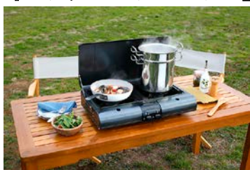
大きな鍋が 2 つ同時調理可能