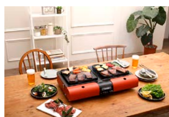
室内でも使えます