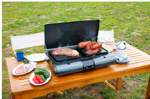
▲②テーブルトップBBQグリル 『フラットツイン・グリル』