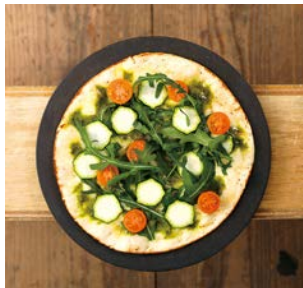
アウトドアでピザ