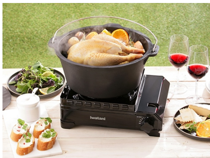
▲①頑強なカセットこんろ 『タフまる』

風のある屋外でも、キッチンで調理するのと同様の加熱能力と使い勝手を備えることで、本格的でバリエーション豊かな料理づくりをサポートします。またアウトドアならではのフォルムで楽しいアウトドアクッキングの雰囲気を一層盛り上げます。