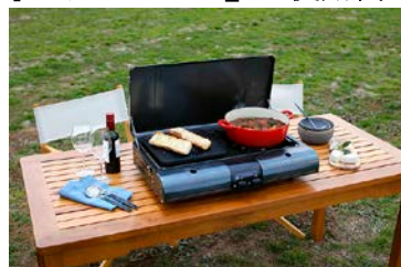
グリルとこんろの複合調理