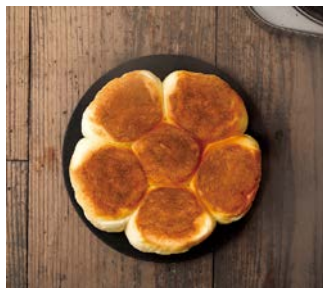
アウトドアでパンを焼く