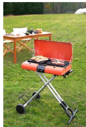
▲③スタンドBBQグリル 『グリルスター』