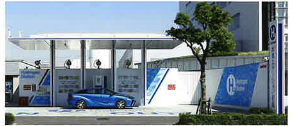
中央研究所の敷地内に併設した水素ステーション

イワタニは、2013年4月に兵庫県尼崎市に全く新たな研究開発拠点として「中央研究所」を開設しました。従来から蓄積してきたガステクノロジーをベースに、新たに世界トップレベルの各種分析機器・多彩な試験環境を整備。お客さまの技術開発に関するご要望にお応えする技術のワンストップサービスの提供を目指します。