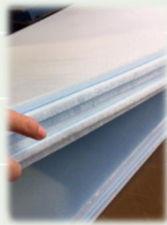
5/1 現状確認 スタイロフォームカット