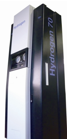
赤外線通信機能付、水素ディスペンサ