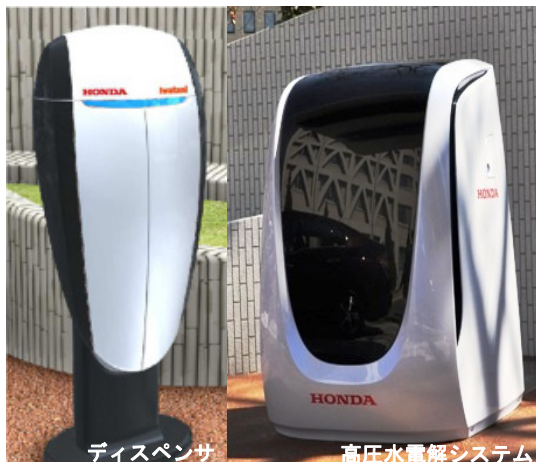
ソーラー水素ステーション用