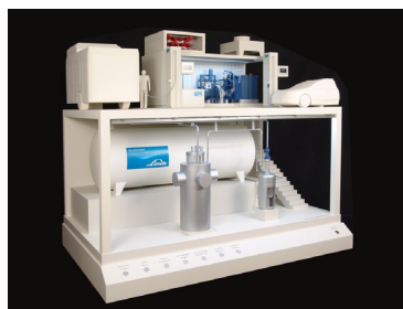
水素ステーション模型