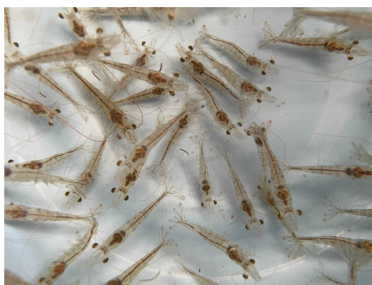
バナメイエビ種苗

バナメイエビは、世界で最も食されているエビです。1尾 15～18 グラム程度の小型サイズが主体で、日本では寿司のネタ、エビフライ、むきエビなど幅広い用途で使われています。このバナメイエビの種苗（養殖のための稚エビ）は海外から輸入することが多く、度々海外由来の特定疾病※2 による被害が発生しています。そのため養殖業者は、全滅することもある病気のリスクに悩まされています。