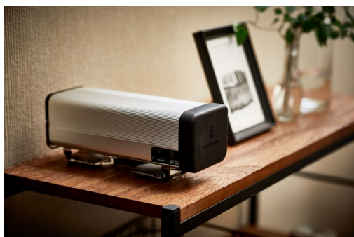
収納時の“FOLDING CAMP STOVE”