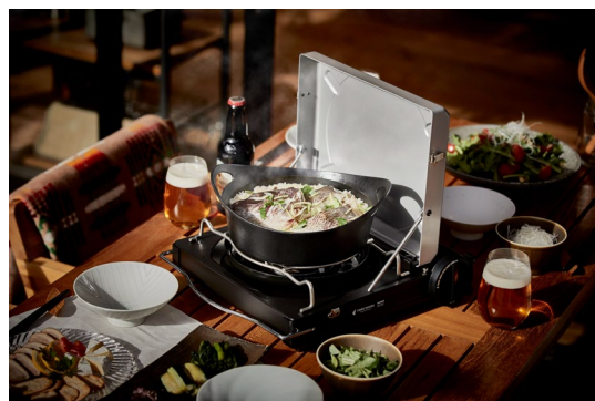
風に強いカセットこんろ