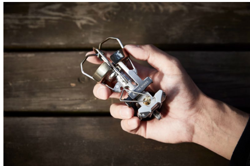
軽量の“MICRO CAMP STOVE”