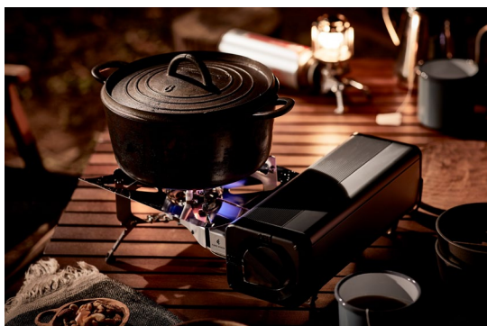
折りたたみ式カセットこんろ

岩谷産業株式会社（本社：大阪・東京、社長：間島寛、資本金：350億円）は、1995年から続く当社のアウトドアオリジナルブランド「FORE WINDS（フォアウィンズ）」のロゴデザインとメッセージを刷新し、新製品5点をアウトドア専門店、スポーツ量販店および当社グループのオンラインショップ「イワタニアイコレクト」で、3月1日より順次発売開始いたします。また、「FORE WINDS」をグローバルブランドと位置づけ、アメリカでも同時展開します。