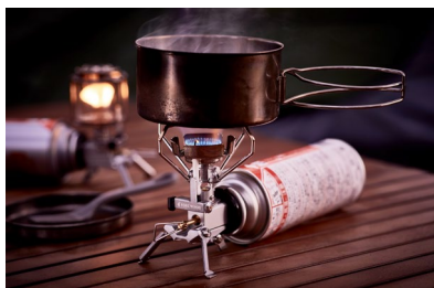
コンパクトで軽量のシングルバーナー