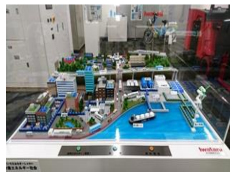
水素社会ジオラマ 模型 (NEW)