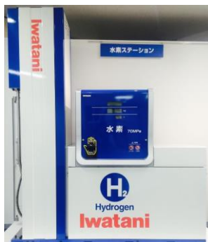
水素ディスペンサー (NEW)