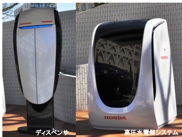
ソーラー水素ステーション用ディスペンサ、高圧水電解システム