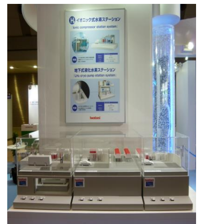
商用水素ステーション（模型）

【お問い合わせ先】 岩谷産業(株) 水素エネルギー部 TEL:03-5405-7030 FAX:03-5405-7022