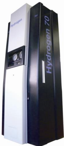
赤外線通信機能付水素ディスペンサ (NEW)