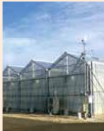
太陽光型植物工場 設計施工