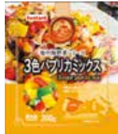
冷凍野菜(消費者用)