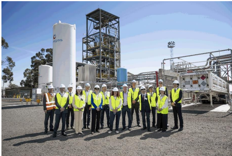
褐炭ガス化・水素精製設備公開の様子

川崎重工業株式会社、電源開発株式会社、岩谷産業株式会社、丸紅株式会社、AGL Energy Limited、住友商事株式会社の6社が参画する水素サプライチェーンの実証試験を行う豪州のコンソーシアムは、豪州ビクトリア州に建設した、褐炭ガス化・水素精製設備（電源開発所掌）と水素液化・積荷基地（川崎重工、岩谷産業所掌）の両施設が運転開始したことに伴い、豪州連邦政府、ビクトリア州政府および在豪日本政府の関係者に対し、本日3月12日、褐炭ガス化・水素精製設備を公開しました。