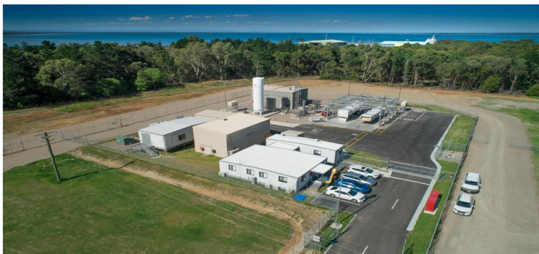
水素液化・積荷基地