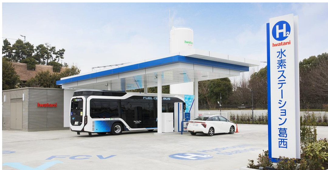
イワタニ水素ステーション 東京葛西

当社は、引き続き、FCVの早期普及およびユーザーの利便性向上に貢献するとともに、水素エネルギー社会の早期実現に向けて積極的に役割を果たしてまいります。